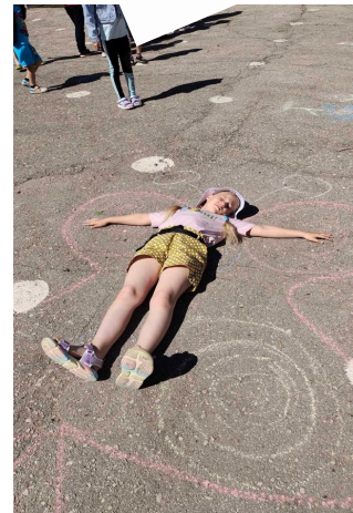
Ребята из ЛДП « Лесная сказка»