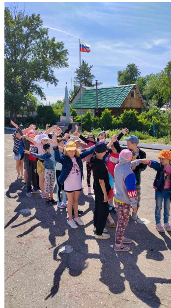
Ребята из ЛДП « Лесная сказка»