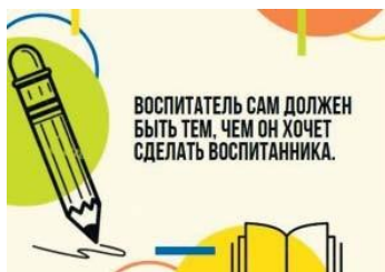
Рис. П2.2. Пример карточки с цитатой