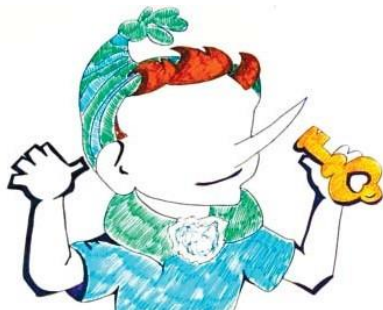
Рис. П2.3. Пример «Буратино»